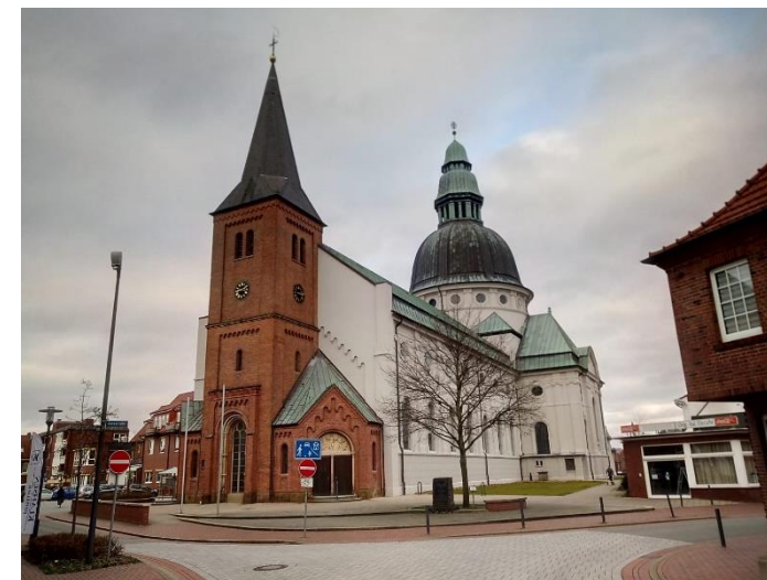
Pfarrkirche „St. Martinus“ – Emsland Dom Kirchstraße, 49733 Haren (Ems) Tel.: 05932-71270

Wir geben Ihnen gerne einige Informationen über unsere Kirchengemeinde.