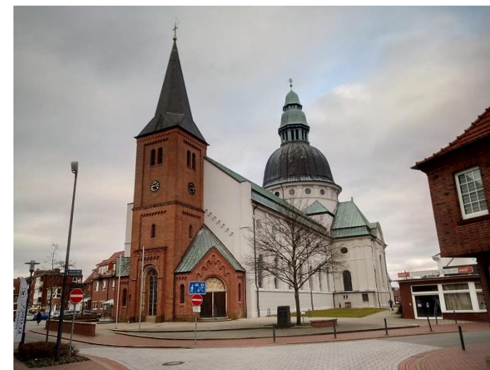
Pfarrkirche „St. Martinus“ – Emsland Dom Kirchstraße, 49733 Haren (Ems) Tel.: 05932-71270

Wir geben Ihnen gerne einige Informationen über unsere Kirchengemeinde.