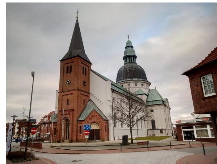
Pfarrkirche „St. Martinus“ – Emsland Dom Kirchstraße, 49733 Haren (Ems) Tel.: 05932-71270

Wir geben Ihnen gerne einige Informationen über unsere Kirchengemeinde.