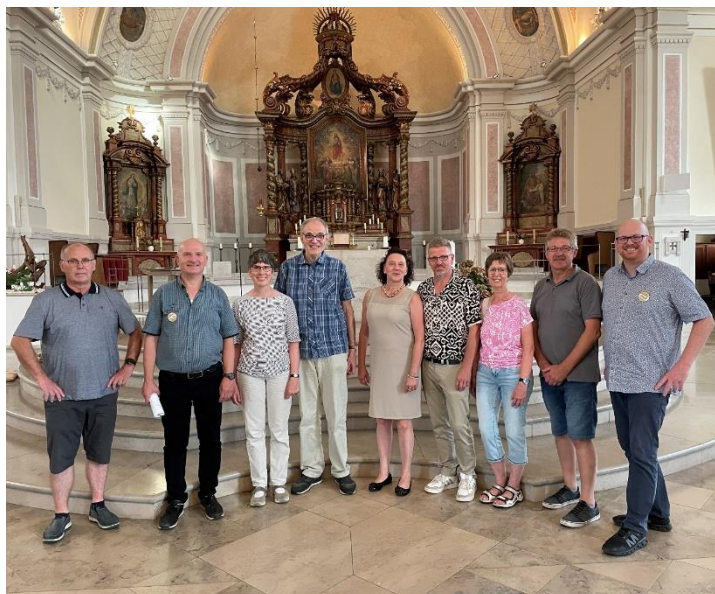
(1. von rechts) zusammen mit Teilnehmern einer Kirchenführung.